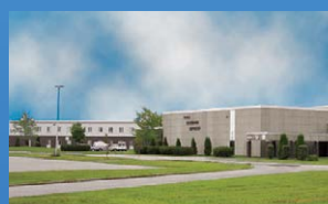
14 ÉCOLE SECONDAIRE NÉPISGUIT BATHURST • Grades 9 - 12