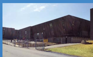
13 ÉCOLE SAINTE-ANNE FREDERICTON • Grades 9 - 12