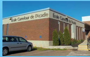
1 CARREFOUR DE L'ACADIE DIEPPE • Grades 6 - 8