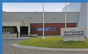
17 POLYVALENTE ROLAND-PÉPIN CAMPBELLTON • Grades 9 - 12