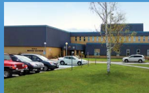
10 ÉCOLE MARIE-ESTHER SHIPPAGAN • Grades 9 - 12