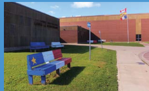
9 ÉCOLE LOUIS-J.-ROBICHAUD SHEDIAC • Grades 9 - 12