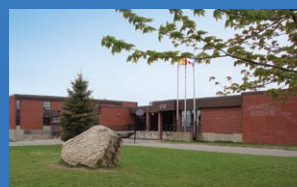
18 POLYVALENTE THOMAS-ALBERT GRAND-SAULT • Grades 7 - 12