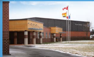
5 ÉCOLE CLÉMENT-CORMIER BOUCTOUCHE • Grades 9 - 12