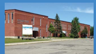
15 POLYVALENTE ALEXANDRE-J.-SAVOIE ST-QUENTIN • Grades 7 - 12