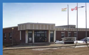
16 POLYVALENTE LOUIS-MAILLOUX CARAQUET • Grades 9 - 12