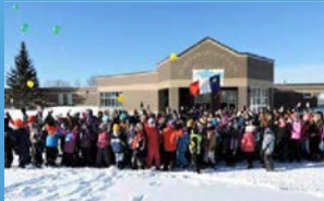
6 ÉCOLE GRANDE-RIVIÈRE SAINT-LÉONARD • Grades K - 12