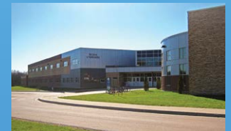
7 ÉCOLE L'ODYSSÉE MONCTON • Grades 9 - 12