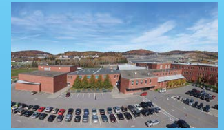
2 CITÉ DES JEUNES A.-M.-SORMANY EDMUNDSTON • Grades 9 - 12