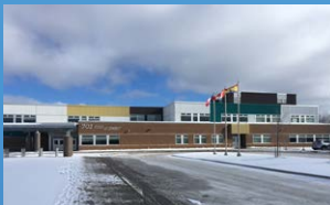
8 ÉCOLE LE SOMMET MONCTON • Grades K - 8