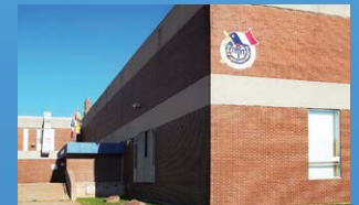
11 ÉCOLE MATHIEU-MARTIN DIEPPE • Grades 9 - 12