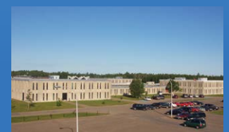
19 POLYVALENTE W.-A.-LOSIER TRACADIE • Grades 9 - 12