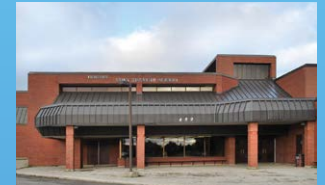
4 ÉCOLE AUX QUATRE VENTS DALHOUSIE • Grades 9 - 12