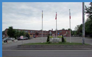
12 ÉCOLE NOTRE-DAME EDMUNDSTON • Grades 1 - 8