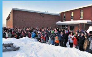
3 ÉCOLE ARC-EN-CIEL OROMCTO • Grades K - 8